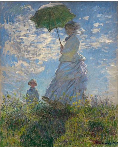
양산을 쓴 여인, 1875