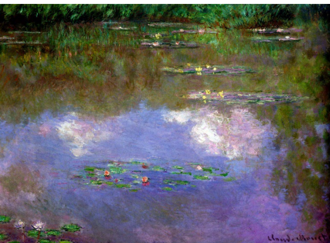
수련, 구름, 1903